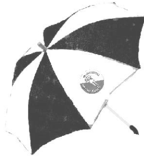
Knirps-Schirm CHF 25.00