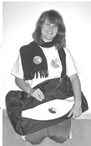
Tasche CHF 25.00 Kindergrößen Shirts CHF 10.00