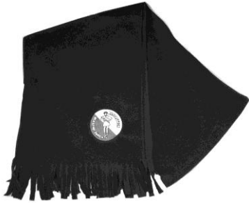
Schal CHF 15.00

Sie suchen noch eine Majorettenenerinnerung? Melden Sie sich per Mail beim Präsidenten.