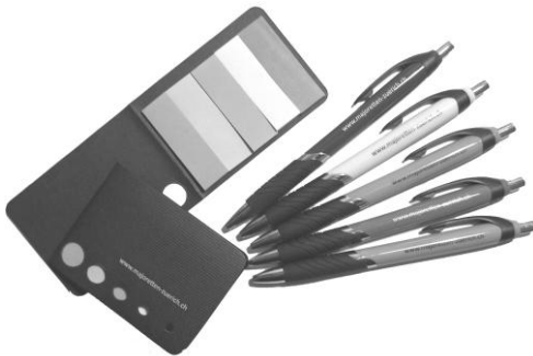
Kugelschreiber mit Memokleber CHF 4.00 Verschiedene Farben